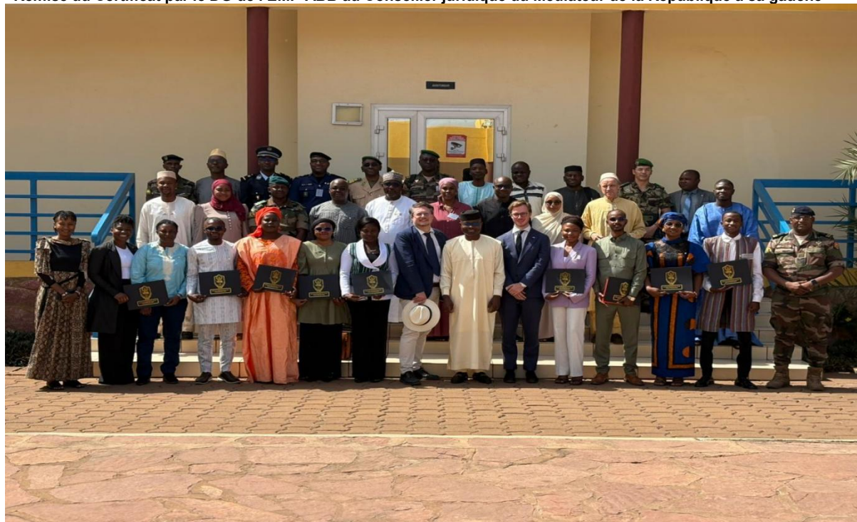
Photo de famille des participants au stage (MPC 2-2025 BEL), avec au centre le DG de l'EMP-ABB, l'Ambassadeur du Royaume de Belgique au Mali et le Premier secrétaire de l'Ambassade de la République fédérale d'Allemagne au Mali